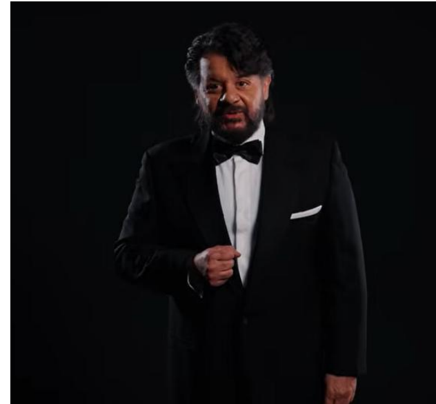
Note di Prevenzione: VIDEOPILLOLA1