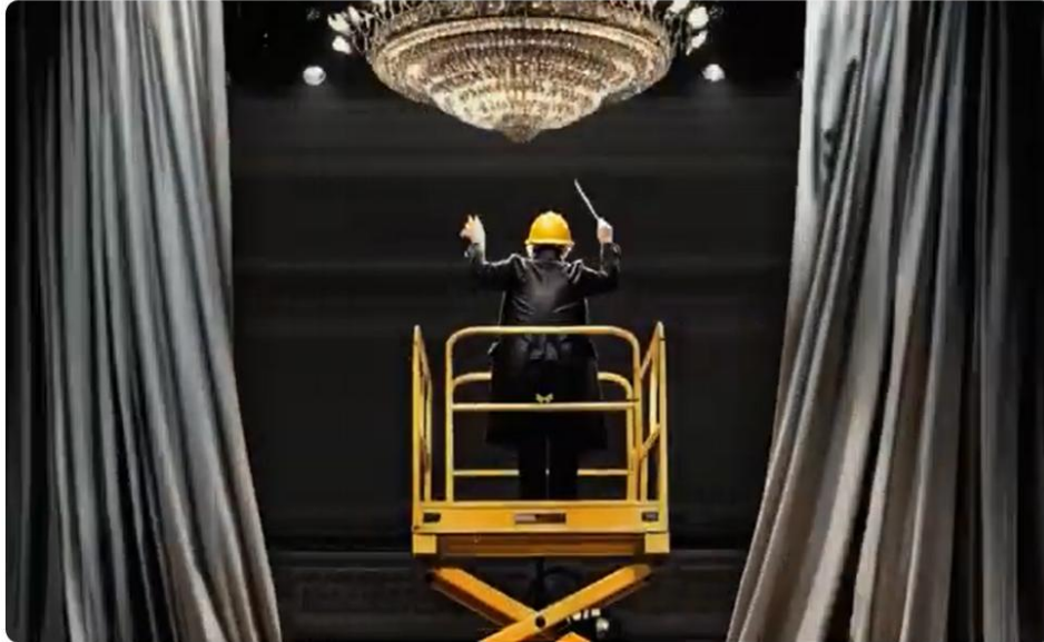
Note di Prevenzione: VIDEO SPOT