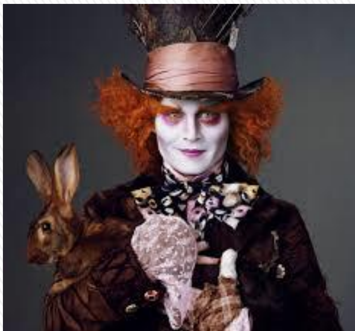
Casa degli RLS