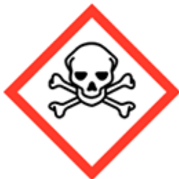
Tossicità acuta categoria 1, 2, 3 - GHS06