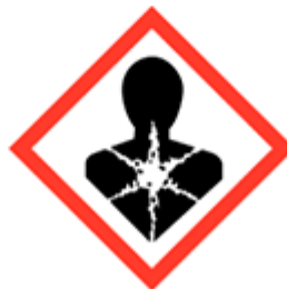
Rischio mutageno, respiratorio, cancerogeno e per la riproduzione GHS08