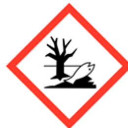
Pericolo per l'ambiente acquatico - GHS09