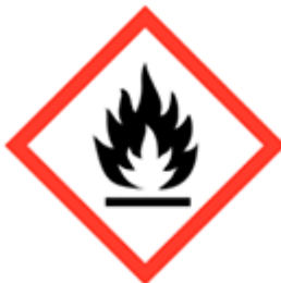
Materiali infiammabili GHS02