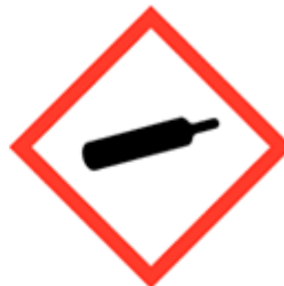
Gas sotto pressione GHS04