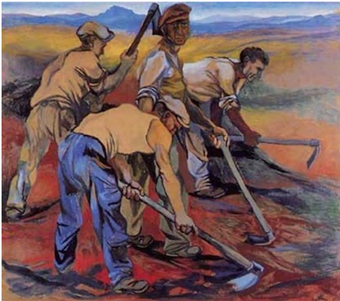
Contadini al lavoro Renato Guttuso