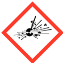
Materiali esplosivi GHS01