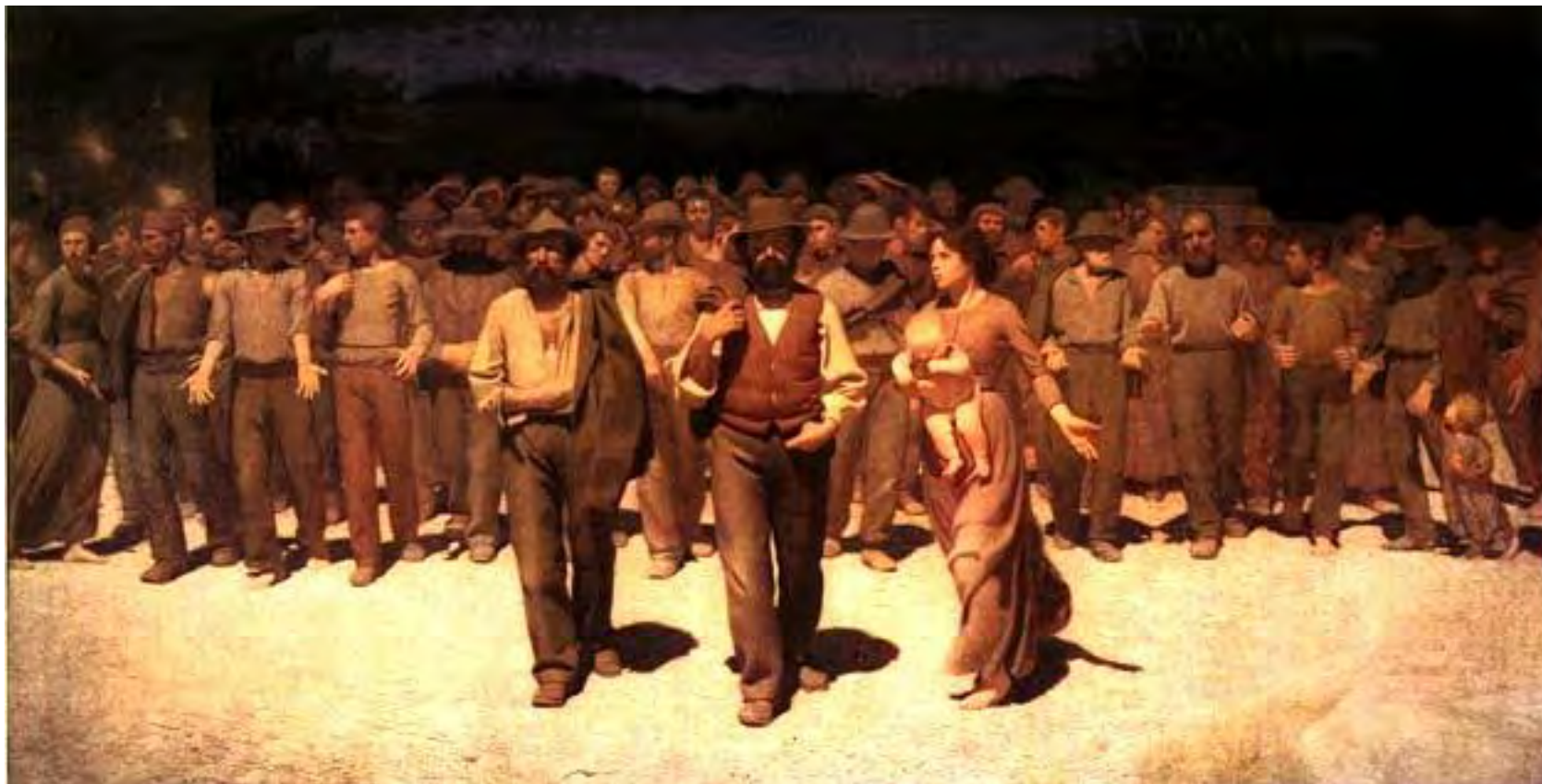
Il quarto stato Pellizza da Volpedo