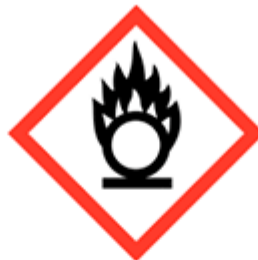
Materiali comburenti GHS03