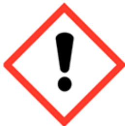
Tossicità acuta categoria 4 - GHS07