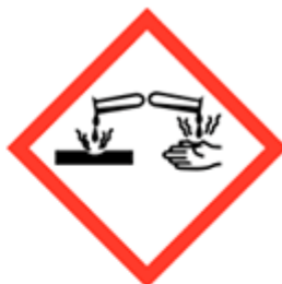
Materiali corrosivi GHS05