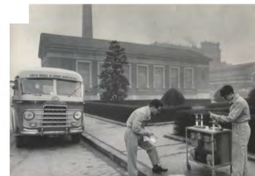
Il Laboratorio di Igiene Industriale e Tossicologia, 1962