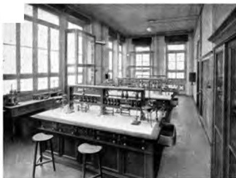
La Clinica del Lavoro e il Laboratorio di Chimica, 1910