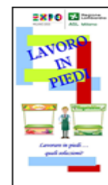
LAVORO IN PIEDI