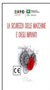
SICUREZZA MACCHINE E IMPIANTI