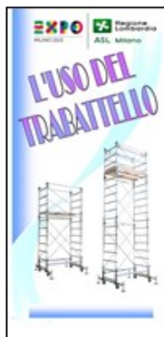
USO DEL TRABATTELO