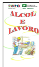
ALCOL E LAVORO