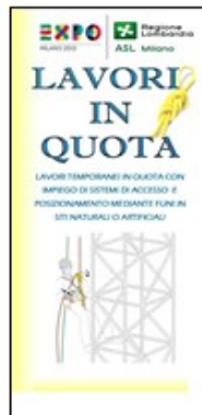
LAVORI IN QUOTA