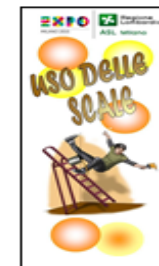
USO DELLE SCALE