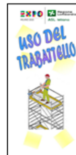
USO DEL TRABATTELO