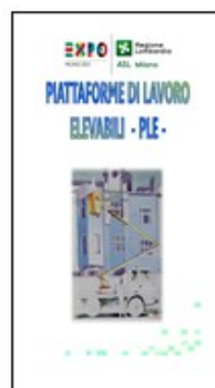
PIATTAFORME LAVORO ELEVABILI